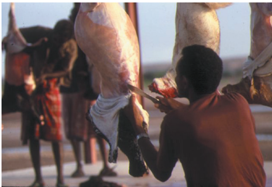
Abattage du mouton à Djibouti. Contrôle de la qualité selon les conditions locales.

La première rend compte d'une norme sociale s'appuyant sur une réglementation, définie, garantie et contrôlée par l'État sur la base d'une exigence sanitaire, civique, ou autre. Dès lors, elle s'impose à tous, et définit des produits «standards». Elle uniformise le marché. Mais elle exclut aussi un certain nombre de produits et d'entreprises incapables de satisfaire aux exigences réglementaires. Cette qualité définit ainsi un seuil en-deçà duquel le produit ne peut être autorisé à la vente. Ses exigences sont établies à la suite d'un compromis, arbitré par la puissance publique, entre le souhaitable et le possible, compromis tenant compte du coût de la mise en œuvre des exigences de la qualité, des souhaits exprimés par les citoyens/consommateurs et des normes