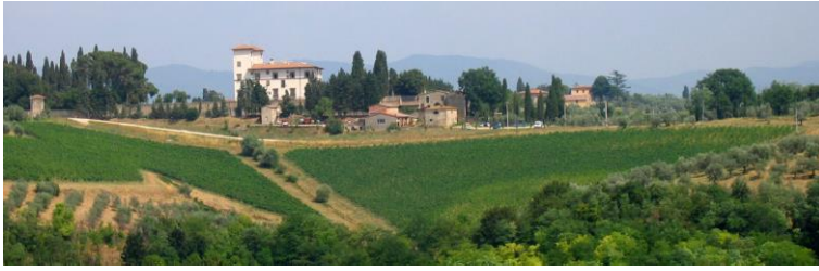
Photo 1 : la villa Le Corti à San Casciano in Val di Pesa (cliché C. Perrin, 2006) Photo 1: Villa Le Corti in San Casciano in Val di Pesa (photo C. Perrin, 2006)