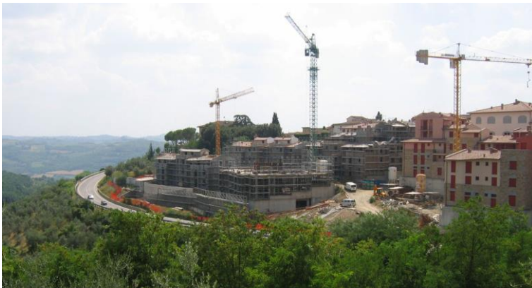
Photo 2 : les nouveaux quartiers construits autour du centre de San Casciano in Val di Pesa Photo 2: new housing developments around San Casciano in Val di Pesa