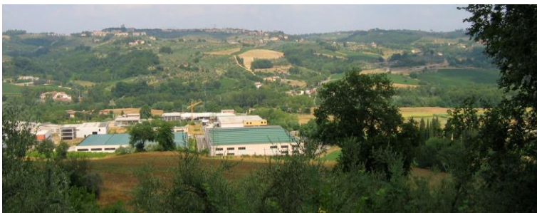
Photo 4 : développements industriels en fond de vallée, San Casciano in Val di Pesa

Photo 3: vineyards and olive groves, with restored farmhouses in San Casciano in Val di Pesa