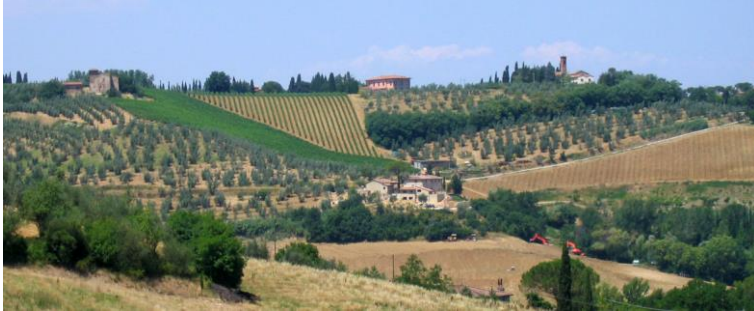
Photo 3 : vignes et oliveraies, ponctuées d'anciennes fermes restaurées, à San Casciano in Val di Pesa

Le territoire du Chianti connaissait ainsi au début des années 1990 une double dynamique économique, avec, d'un côté, le succès croissant du vin Chianti Classico porté par le consorzio , et, de l'autre, la poursuite de la périurbanisation et du développement industriel diffus encouragée par les municipalités de gauche (photo 4). Ces deux stratégies de développement très différentes réussirent à s'articuler au sein d'un projet de territoire à la faveur des financements européens.