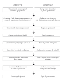
Figure 2. Approche méthodologique