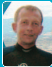
Jean-Marc Bel Contributeur