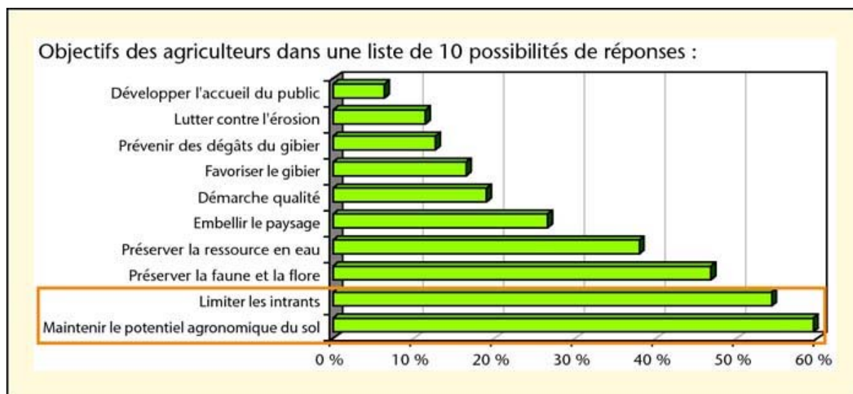
Figure 4 : Résultats des réponses des 80 agriculteurs participants, à une question extraite du questionnaire préalable au diagnostic

Pour autant, la biodiversité n'est pas une finalité en soit pour la plupart d'entre eux. En effet, à la question "quels sont vos objectifs ?", à choisir dans une liste de 10 possibilités (Figure 4), les premières réponses mentionnées sont "maintenir le potentiel agronomique du sol" et "limiter les intrants". Ceci atteste que les finalités agro-économiques priment. Donner une entrée agronomique au conseil sur la prise en compte de la biodiversité et démontrer ses intérêts sur ce plan, semble donc être un nécessaire levier pour sensibiliser une majorité d'agriculteurs.