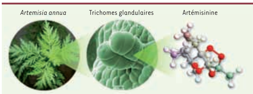
Figure 1. Localisation de l'artémisinine au sein de la plante Artemisia annua L. L'artémisinine est une molécule synthétisée dans les trichomes glandulaires situés majoritairement sur les feuilles d' Artemisia annua .

Le moteur du progrès génétique étant la variabilité, la stratégie développée