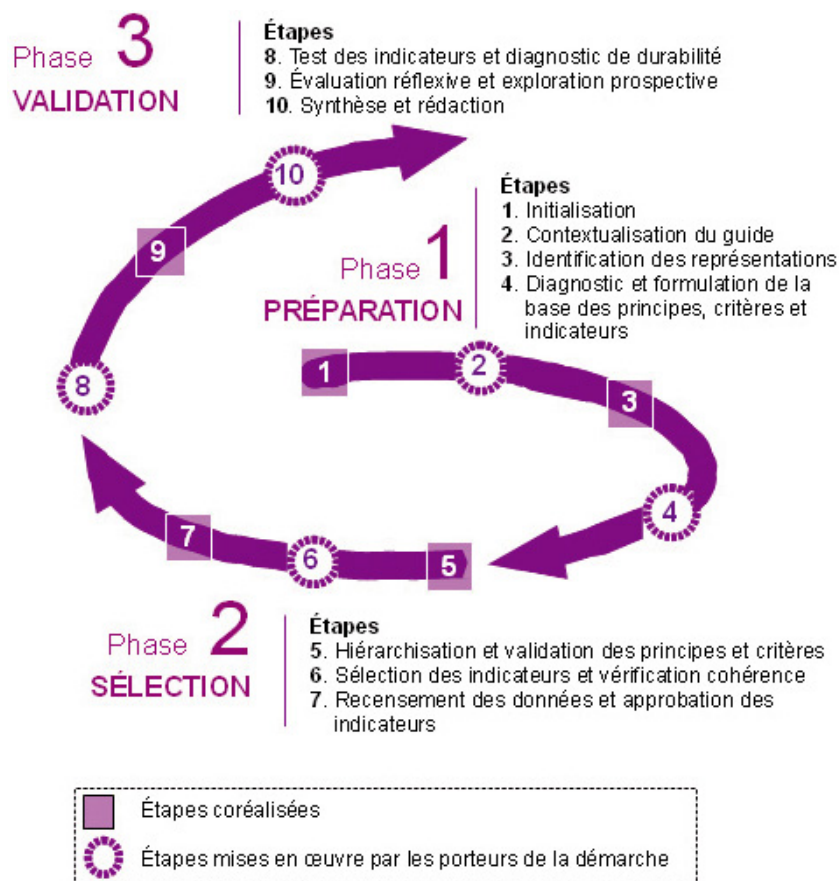
Fig. 2. Présentation résumée du protocole de mise en œuvre de la démarche de coconstruction « principes, critères, indicateurs » (PCI).

par les acteurs. L'analyse des représentations a été réalisée dans l'ensemble des terrains, c'est-à-dire sur la base d'une large variété de systèmes aquacoles, de façon à tenir compte de la diversité des contextes et des niveaux de développement de l'activité. Il s'agissait d'entretiens semi-directifs réalisés auprès de l'ensemble des parties prenantes des systèmes aquacoles concernés (Fig. 3) et portant sur leurs représentations du développement durable, ainsi que des conséquences et des changements prévisibles ou possibles quant aux pratiques