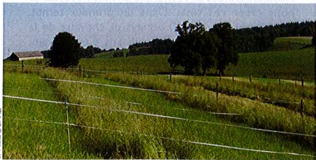
Photo 1 : couverts végétaux variant simultanément en hauteur et en qualité

Des travaux récents, conduits en collaboration entre Les Haras nationaux, l'équipe relations animal - plantes - unité de recherches sur les herbivores de l'INRA (institut national de la recherche agronomique) de Clermont-Ferrand / Theix et le centre d'études biologiques du CNRS (centre national de la recherche scientifique) de Chizé, ont permis de préciser l'influence de certains facteurs liés à la végétation, sur les choix alimentaires et l'ingestion des chevaux au pâturage.