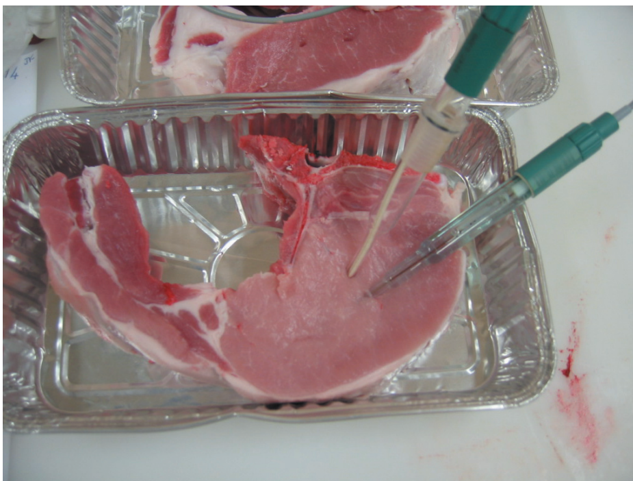
Mesure du pH ultime dans la viande.

Chez le porc, des études ont montré que la teneur en lipides des tissus adipeux était diminuée suite à une supplémentation en CLA des aliments, du fait de l'inhibition des enzymes impliquées dans la synthèse des lipides (Corino et al 2003), ce qui peut présenter un intérêt pour la qualité nutritionnelle de la viande. La teneur en CLA de la viande est également augmentée (Corino et al 2006, Bee et al 2008). Mais, face aux interrogations par rapport aux bénéfices santé réellement apportés par les CLA, et face au surcoût alimentaire induit par l'enrichissement des ali-