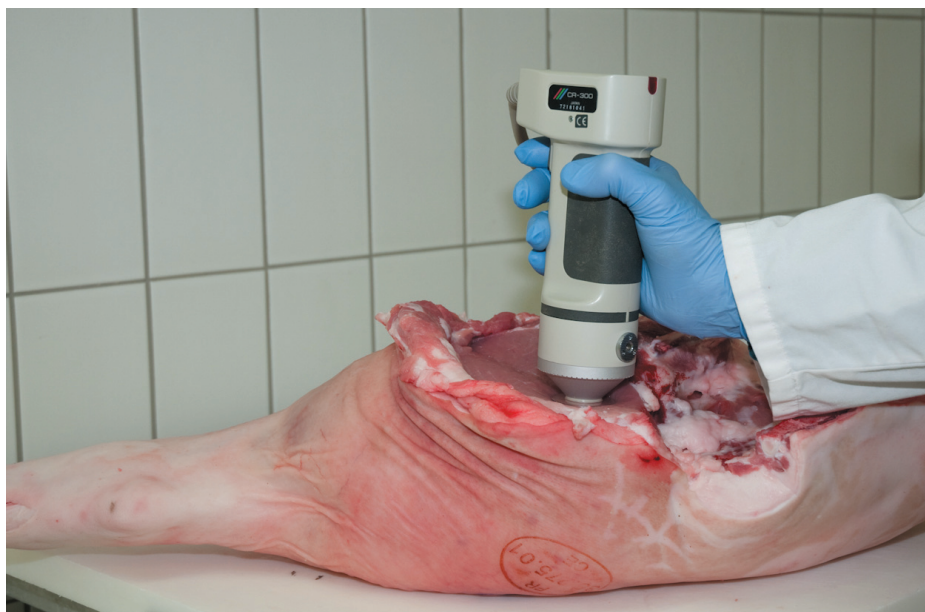
Détermination de la couleur de la viande par chromamètre.

pas donner les résultats attendus. La viande est certes enrichie en cet acide gras, mais pas autant que l'on pouvait espérer. Cet acide gras est vraisemblablement préférentiellement oxydé au niveau des peroxysomes le rendant peu disponible pour le stockage (Mourot 2009).