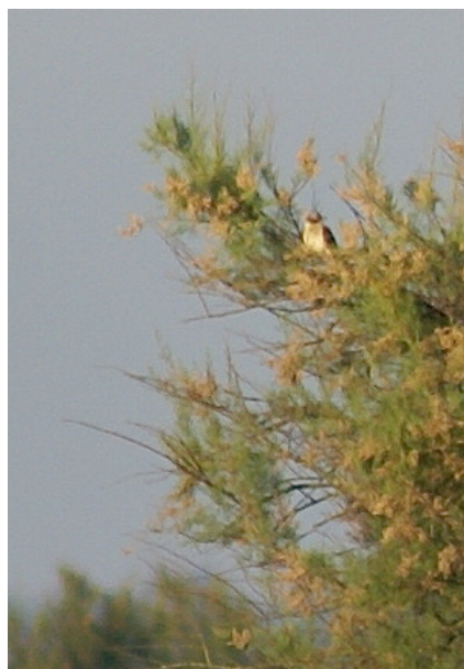
Coucou-geai adulte ou 1er été – Domaine de Certes (33), juin 2009

sés dans la région de Madrid en mars, tous ne contenaient que de la processionnaire (Valverde 1953, Hoyas & Lopez 1998). Lors des parades nuptiales qui ont lieu de mars à mai dans le sud de l'Espagne, le mâle nourrit la femelle de chenilles en majorité (42%) puis secondairement de Coléoptères (17%) et d'Orthoptères (17%) (Soler 1990). Les jeunes coucou-geais étant nourris par leurs parents adoptifs surtout de Coléoptères et d'Orthoptères (Soler et al. 1995), l'habitude de prédater les chenilles urticantes est sans doute acquise plus tard par l'oiseau adulte (Gill 1980).