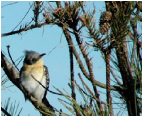
Coucou-geai adulte – Bonne Anse, Les Mathes (17), janvier 2008 (René Cuinet)

récent date de cette année dans le Marais Poitevin, où 2 jeunes ont été élevés par un couple de pies entre le 27 mai et le 11 juin 2009, le nid de pie parasité étant situé dans un saule bordant une carrière, et aucun adulte n'ayant été observé au préalable sur le site (J. Sudraud com. pers. , photos sur www.faune-vendee.org ). En attendant, il semble être un migrateur pré- et post-nuptial assez régulier, et sans doute en augmentation dans la région. L'expansion en latitude et en altitude de la processionnaire du pin en France, sous l'effet du réchauffement climatique (Battisti et al. 2005), pourrait d'ailleurs lui être favorable à l'avenir.