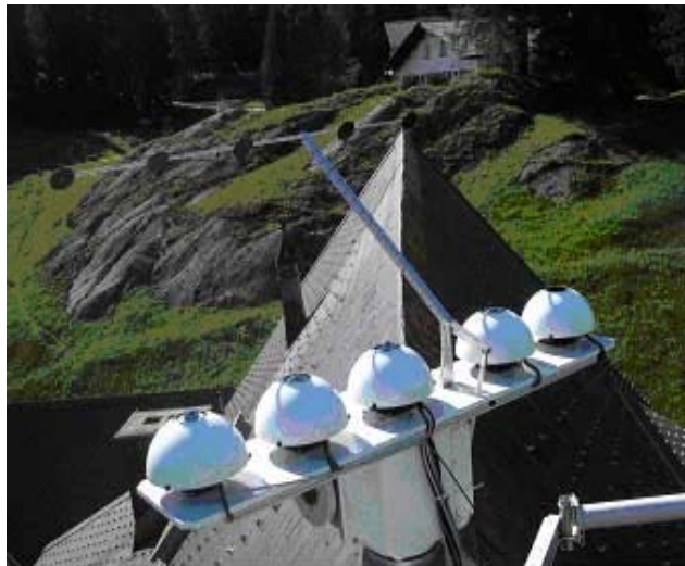
Figure 2 : Groupe étalon infrarouge mondial (WISG) au PMOD/WRC

Le WISG se compose actuellement de quatre pyrgéomètres : deux modèles Precision Infrared Radiometer (PIR) d'Eppley, et deux modèles CG4 de Kipp & Zonen. Tous les instruments sont montés sur un traqueur afin d'ombler le rayonnement solaire direct. Ces instruments sont eux même comparés à un radiomètre absolu à balayage du ciel et à d'autres pyrgéomètres dans le cadre des comparaisons internationales (International Pyrgeometer and Absolute Sky Scanning Comparison, IPASRC-II, Alaska, mars 2001).