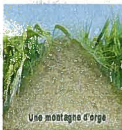
Une montagne d'orge