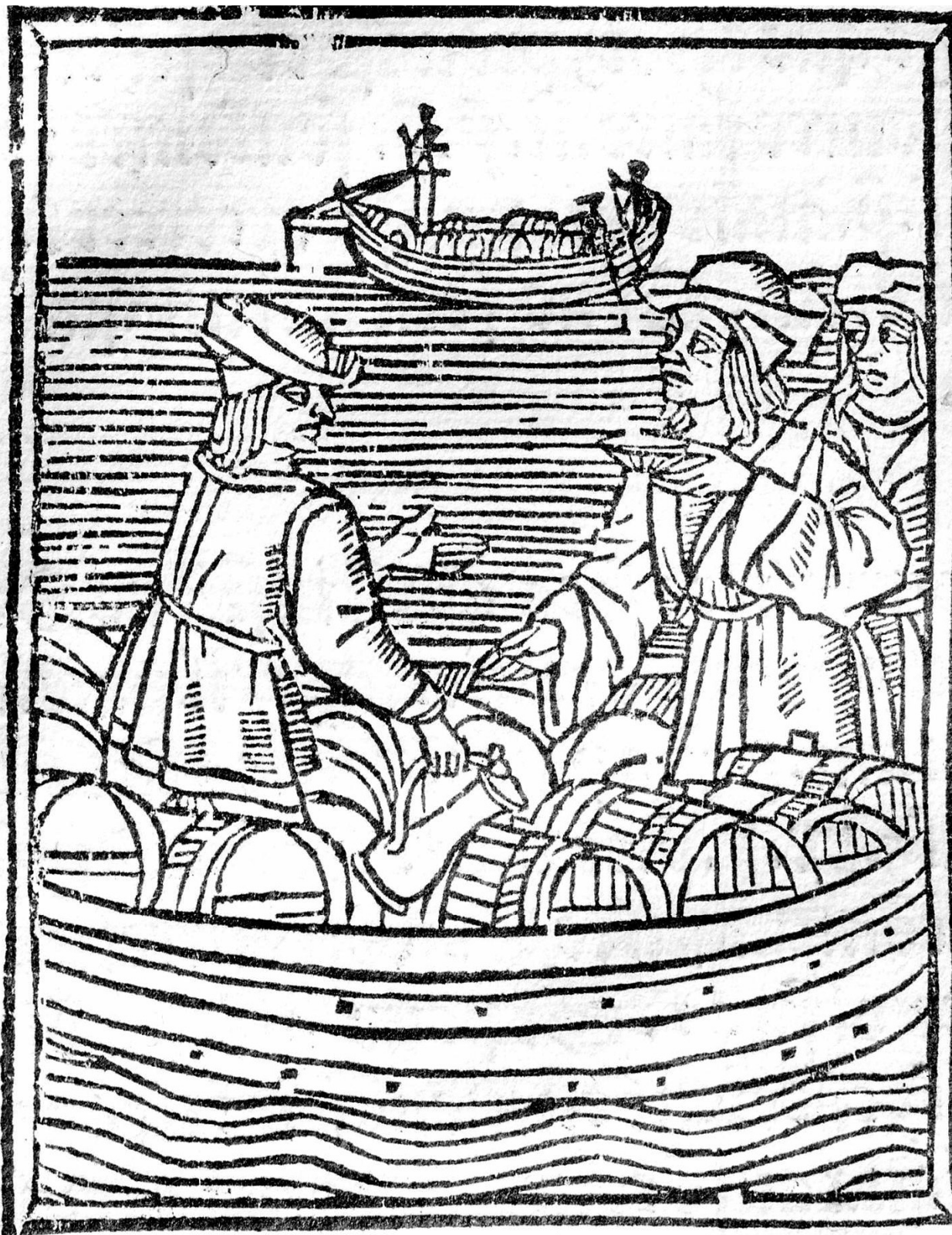
Illustration d'un traité juridique et administratif sur les courtiers en vins à Paris, au XVI e siècle.