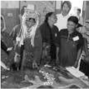
Figure 3a. Joueurs discutant autour du plateau de jeu pendant une session de jeu