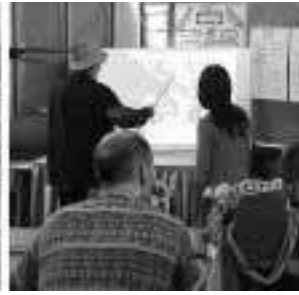
Figure 3c. Simulations participatives à l'aide du modèle SMA