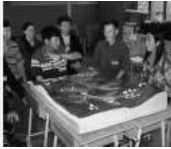
Figure 3b. Présentation des propositions des villageois à la présidente de l'administration du TAO