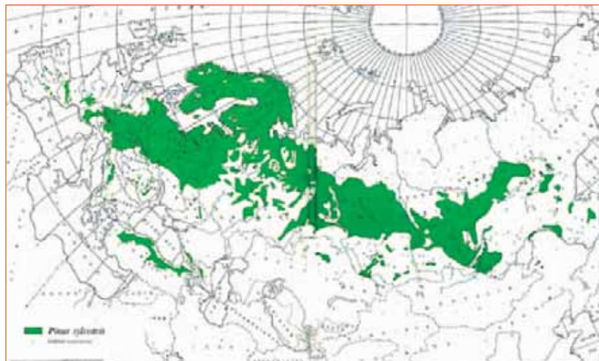
Fig. 2 : aire naturelle de distribution du pin sylvestre (d'après Critchfield et Little, 1966)

Les populations naturelles françaises se situent aux marges sud-ouest de cette aire.