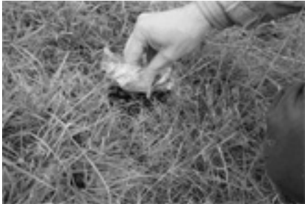
Figure 5. La coproscopie à partir des fèces d'animaux infestés demeure la méthode de diagnostic de référence pour les strongyloses gastro-intestinales mais d'autres approches fondées sur l'évolution de signes cliniques ou de critères zootechniques sont en cours de validation.