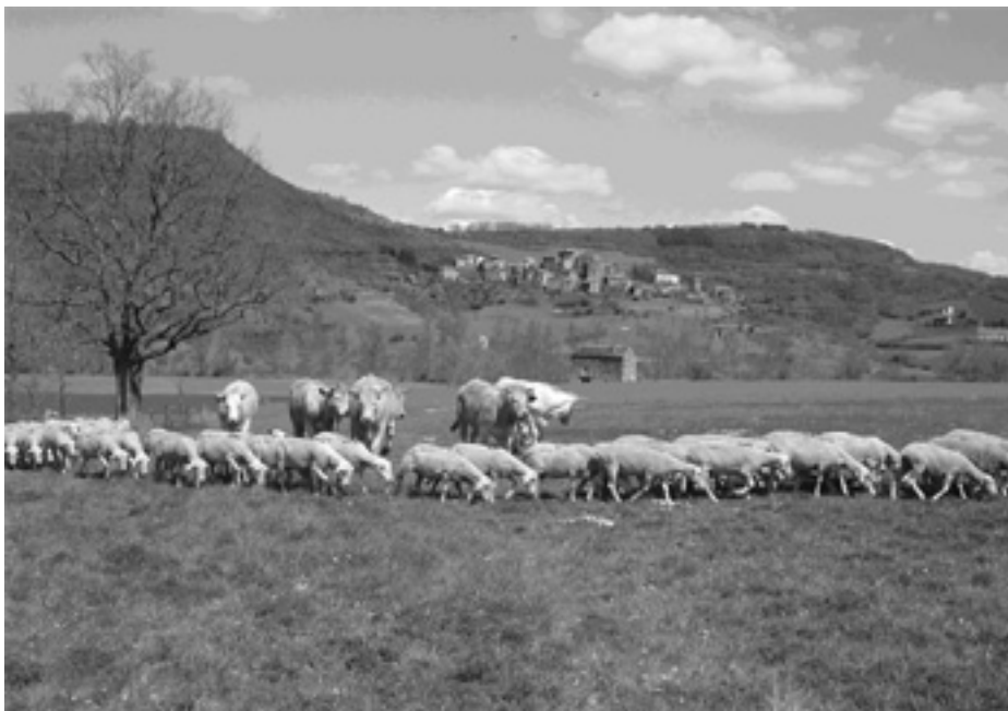
Figure 2. Le pâturage mixte, alterné ou simultané, entre bovins et petits ruminants est une des méthodes de gestion ayant montré une efficacité pour réduire le parasitisme par les strongles gastro-intestinaux.