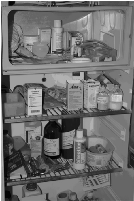
Figure 4. En AB, les traitements antiparasitaires ne doivent plus constituer la pierre angulaire de la maîtrise du parasitisme qui doit plutôt reposer sur des mesures visant à réduire les contacts avec les éléments infestants ou à améliorer la réponse de l'hôte. Restreindre l'usage des molécules chimiques demeure un objectif valide en élevage AB.