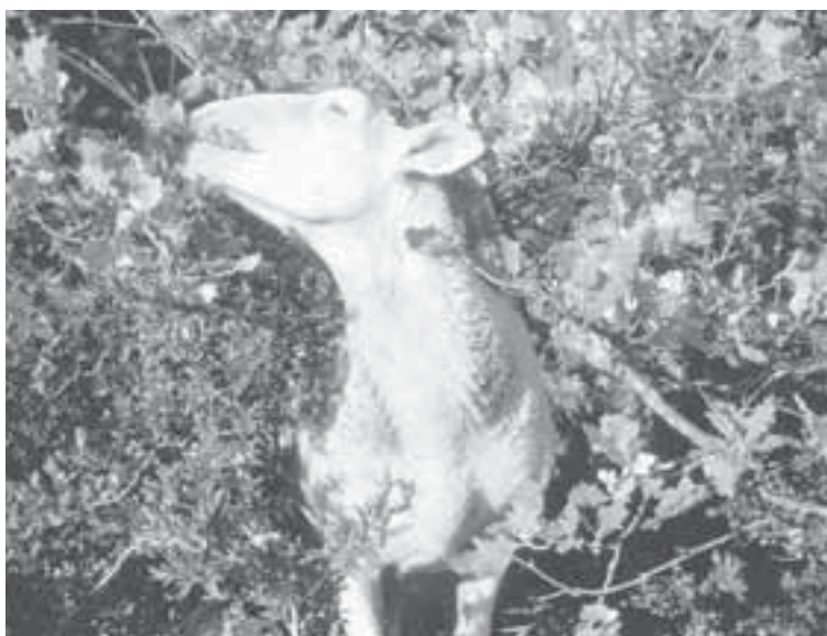
Pour un ruminant, ici une brebis Préalpes, des feuillages d'arbres sont de valeur alimentaire aussi bonne en été qu'une prairie semée de qualité.

Les broussailles ne sont donc pas un « fourrage grossier », consommé uniquement pour faire du volume. Elles ont pour la plupart une très bonne valeur alimentaire. Les parties broutées ne sont d'ailleurs souvent pas plus ligneuses que de l'herbe ou du foin. Les limbes de feuilles et les pétioles, parties qui constituent plus des trois-quarts du régime brouté, présentent ainsi