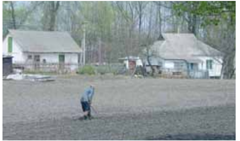
Les cultures et élevages modestes sur 0,5 à 2 hectares nourrissent en moyenne trois générations

L'émergence des fermes individuelles, initiée en 1992, est fonction des relations qu'entretiennent