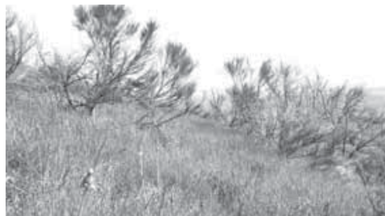
Deux années de pâturage ont suffi aux brebis sur le Puy d'Ysson (Solignat) pour faire régresser les genêts au profit d'une herbe diversifiée et de qualité