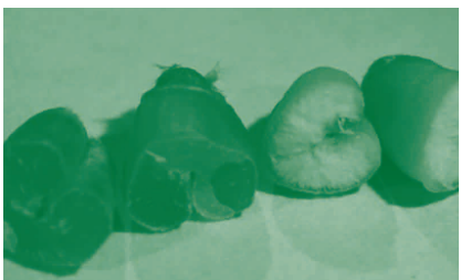
A gauche grains vitreux (de qualité) A droite grains mitadinés

Un programme de recherche a débuté en 2000 à la station expérimentale de l'INRA à Mauguio, où 150 lignées provenant soit de croisements entre blé dur et espèces apparentées, soit de populations à base génétique large, ont été testées dans des conditions « zéro intrant ». A l'issue de premiers tests, 13 d'entre elles ont été retenues sur des critères de qualité semoulière et notamment sur l'absence de mitadin. Le mitadin correspond à un grain farineux (type blé tendre) pénalisant fortement le rendement semoulier.