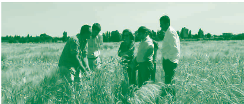
Sélection variétale entre agriculteurs et sélectionneurs

En 2001, ces lignées en génération F5 ont été fournies aux agriculteurs qui les ont évaluées dans leurs agrosystèmes biologiques. Il s'agissait d'un des premiers exemples en France de sélection de lignées de céréales avec une pépinière implantée dans des conditions réelles d'agriculture biologique. En effet, les variétés dites « adaptées à l'agriculture biologique » et disponibles dans le catalogue officiel sont, jusqu'à présent, issues d'une sélection conventionnelle réalisée dans des agrosystèmes non biologiques avec des apports d'intrants et notamment azotés relativement importants. L'objectif ici est de soumettre les plantes, dès le croisement, aux conditions de culture biologique, dans des sols peu fertiles, et ainsi de repérer les plus adaptées à ce type de production.