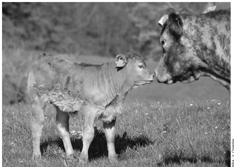
Un impact positif mais modeste pour le système naisseur

Pour les éleveurs spécialisés en production ovine, l'augmentation des aides directes est forte en moyenne nationale, en raison notamment de l'octroi d'une nouvelle prime couplée à la brebis. Elle est estimée à 51% pour les exploitations d'ovins viande (soit + 14 200 euros par exploitation) et à 37% pour les exploitations d'ovins laitiers (soit + 8200 euros par exploitation). Après application des mesures, les exploitations spécialisées en ovins viande bénéficient d'un montant élevé d'aides directes (41 800 euros). Près du tiers de celles-ci relève du deuxième pilier de la PAC qui soutient la mise en valeur de territoires à fortes contraintes dans lesquels est désormais concentrée une forte proportion de ces élevages. Cette hausse importante des soutiens répond à l'objectif de rééquilibrage de revenus des élevages ovins, très inférieurs à la moyenne générale et de parité des aides du premier pilier avec l'élevage de vaches allaitantes. De fait, il ramène le montant des aides directes du premier pilier par emploi agricole au même niveau pour les deux types d'exploitations (ovins viande et bovins viande), sachant qu'elles conduisent des cheptels