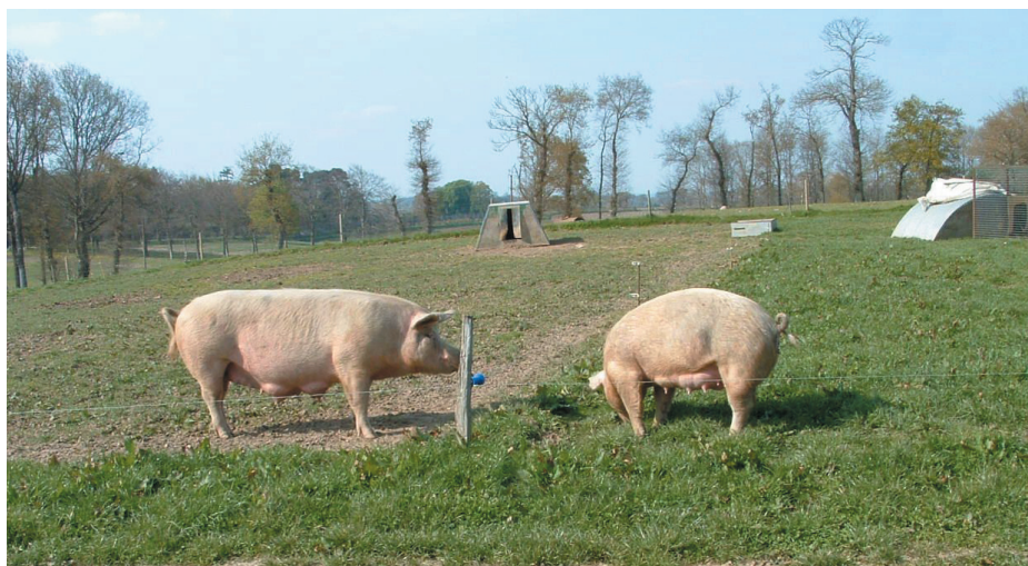
INRA : A. Prunier

En termes sanitaires, les éleveurs de plein air pratiquent la rotation des prairies pour éviter les problèmes de parasitisme. La majorité des éleveurs utilisent des traitements contre les parasites internes des truies qu'elles soient en plein air ou en bâtiment et traitent les porcelets en post-sevrage, mais seulement une minorité d'éleveurs traitent les porcs charcutiers ( Corepig ). L'utilisation d'antibiotiques est très rare et la plupart des éleveurs pratiquent des vaccinations notamment contre le Rouget et le Parvovirus (Maupertuis et Calvar, communication personnelle). Selon les ingénieurs des Chambres d'Agriculture qui suivent ces élevages, les problèmes sanitaires