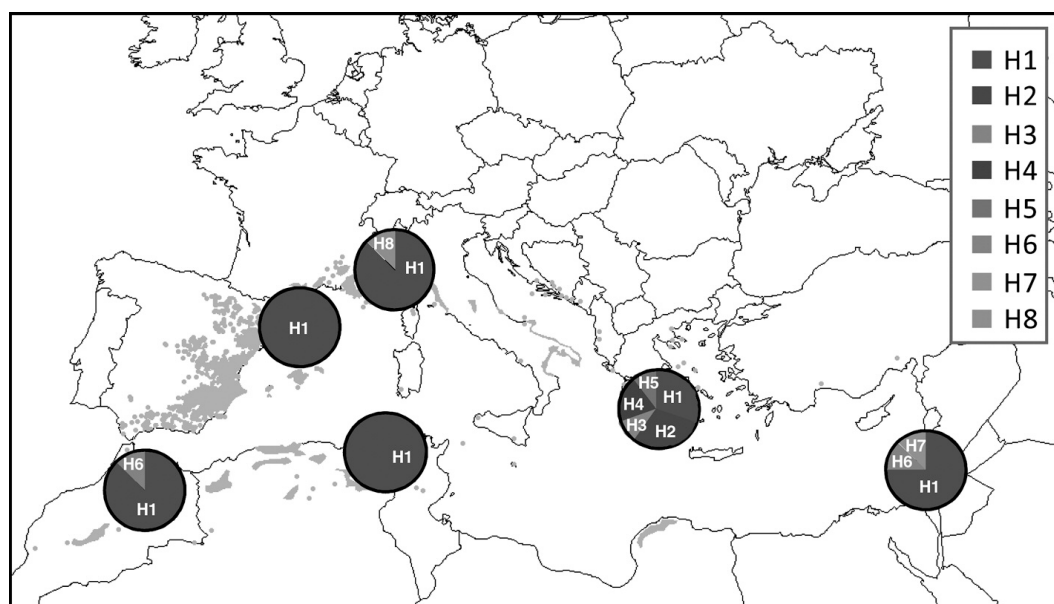
Fig. 2 : Distribution des haplotypes du gène-candidat dhn1 superposé sur la carte de répartition de P. halepensis . La faible diversité de ce gène dans la région occidentale est remarquable.