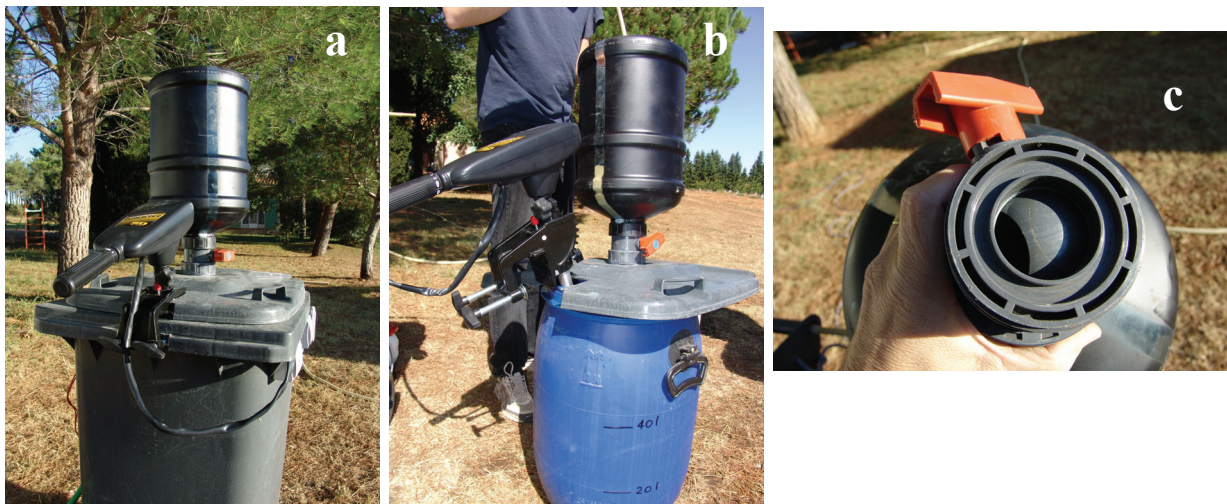
Figures 2 : vues d'ensemble du système sur différents bacs mélangeurs

Nous ajustons la vitesse du moteur et l'ouverture du robinet en fonction du mélange à effectuer. Ce système évite la formation de grumeaux.