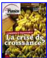
Commerce équitable La crise de croissance ?