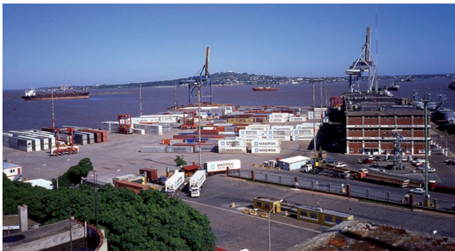
Le terminal à conteneurs de Montevideo en 2003