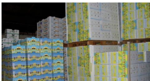
Oranges uruguayennes prêtes à l'expédition en vrac palettisé en 2003.