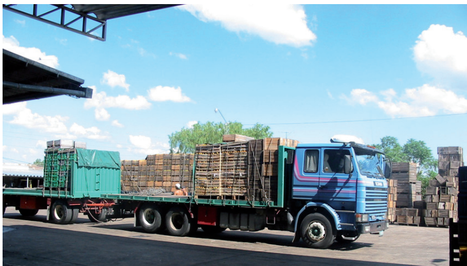
Pré-acheminement camionné des oranges conditionnées en vrac sur palette (vrac palettisé)