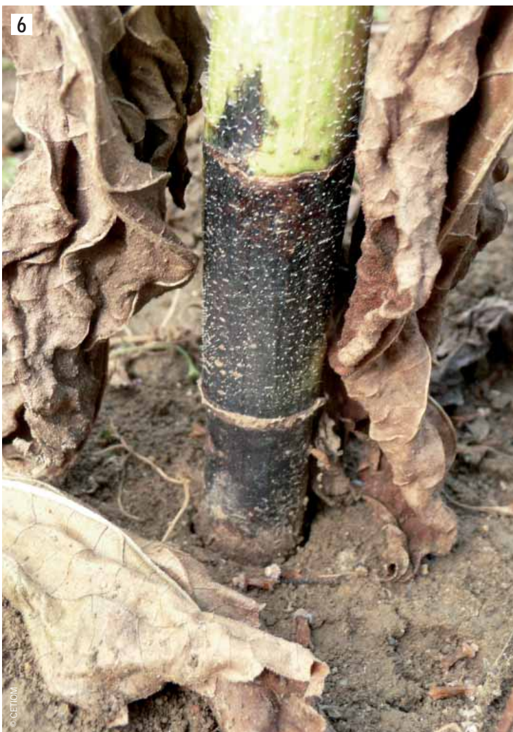
Symptôme de phoma au collet.