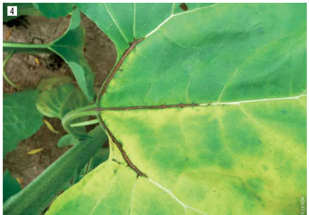
Symptôme « patte d'oie » de phoma sur feuille.

• un rétrécissement du diamètre du collet ; • un flétrissement brutal du feuillage puis sa sénescence 15 jours à un mois avant la maturité physiologique des plantes saines.