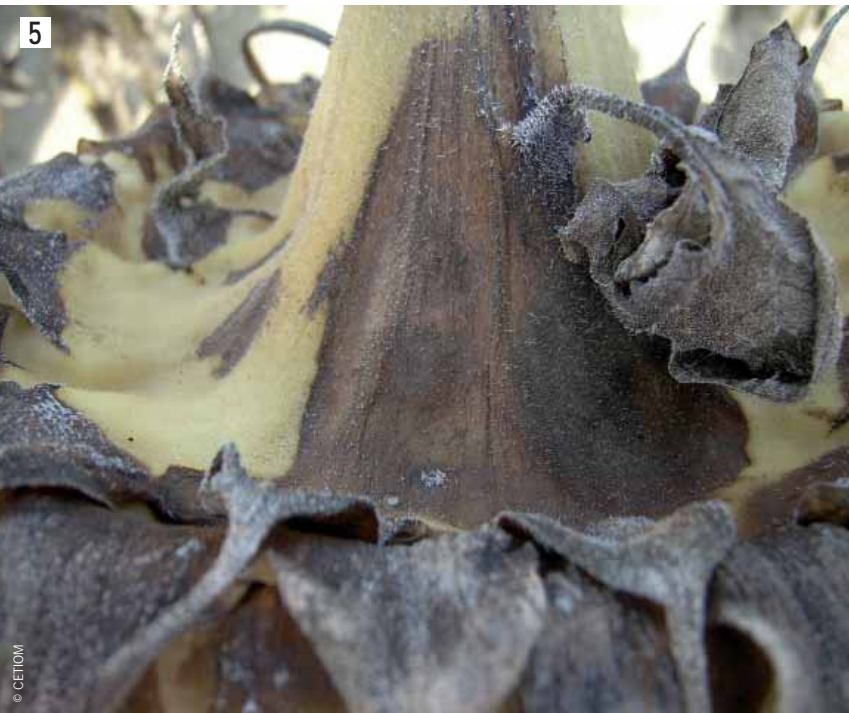
Symptôme de phoma sur capitule.

est majoritairement détecté, le macrophomina et le fusarium sont également mis en évidence. La fréquence de détection de ces différents champignons dans les tissus de la zone collet-racines des plantes, son évolution au cours du processus de dessèchement et la nature des tissus infectés ne permet pas de remettre en cause la notion de complexe parasitaire associée au dessèchement précoce. Elle suggère plutôt une hiérarchie dans l'intervention de ces différents champignons, le phoma apparaissant clairement comme l'agent causal principal du dessèchement précoce.