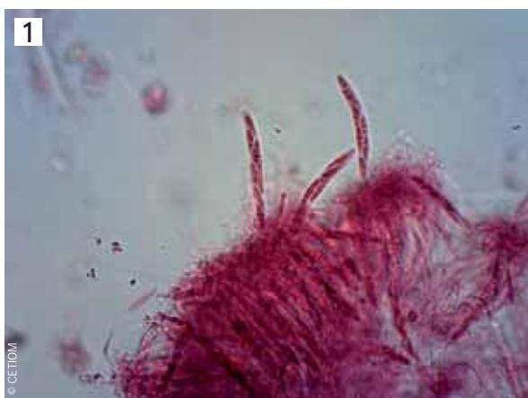
Ascospores de phoma.

Les attaques sur la tige sont les plus connues et ont donné son premier nom à la maladie, « la maladie des taches noires » : elles se caractérisent par une tache noire au niveau