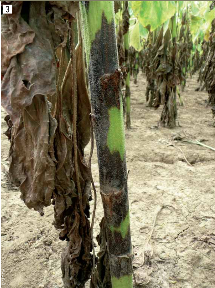
Symptômes de phoma sur tige.