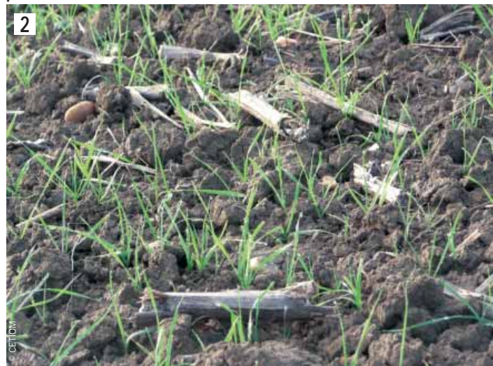
Résidus infectés de la campagne précédente.

Toutes formes d'attaques confondues, le CETIOM évalue la nuisibilité du phoma à 3-4 q/ha/an au niveau national.