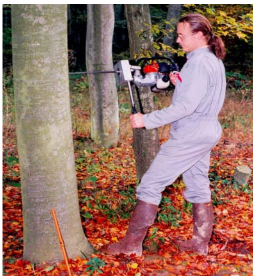
Photo 4 : vissage d'une mèche au carotteur à moteur thermique

Au sein de l'Equipe Phytoécologie Forestière, nous avons besoin de carotter des bois plus durs comme le Chêne et le Hêtre. C'est pourquoi nous avons conçu, avec une entreprise de mécanique industrielle qui le commercialise actuellement, un carotteur similaire à celui de Greig, mais plus léger. Il se compose d'une chignole classique visseuse-dévisseuse à moteur thermique deux temps et d'un réducteur de vitesse ( photo 4 ). L'ensemble pèse 8,2 kg, poids maximum admissible pour un appareil portable. Il permet tout de même d'atteindre un couple de 60 \text{ N.m}^{-1} pour une vitesse de rotation de sortie de 45 \text{ t min}^{-1} . Son utilisation nécessite le port de coquilles antibruit.