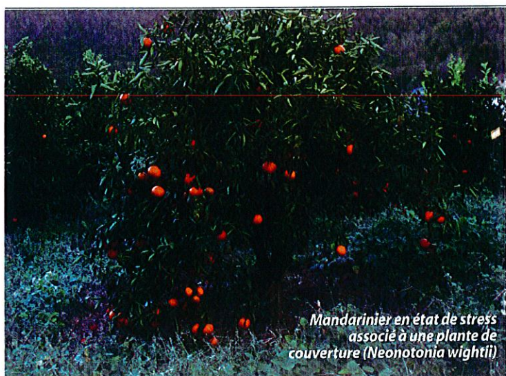
Mandarinier en état de stress associé à une plante de couverture ( Neonotonia wightii )

élevée et des pentes importantes (30% et plus) sujettes à l'érosion. Cet essai a permis d'étudier deux modes de gestion de l'enherbement en verger de mandariniers adultes : (i) implantation d'une légumineuse volubile ( Neonotonia wightii ) et (ii) pratique de l'agriculteur (désherbages chimiques motivés par une mécanisation impossible liée aux pentes). Les relevés réalisés sur 3 années avaient pour objectifs communs de confronter les avantages et inconvénients liés à ces 2 modes de gestion de l'enherbement notamment vis-à-vis de la maîtrise des adventices, de la lutte contre l'érosion et des