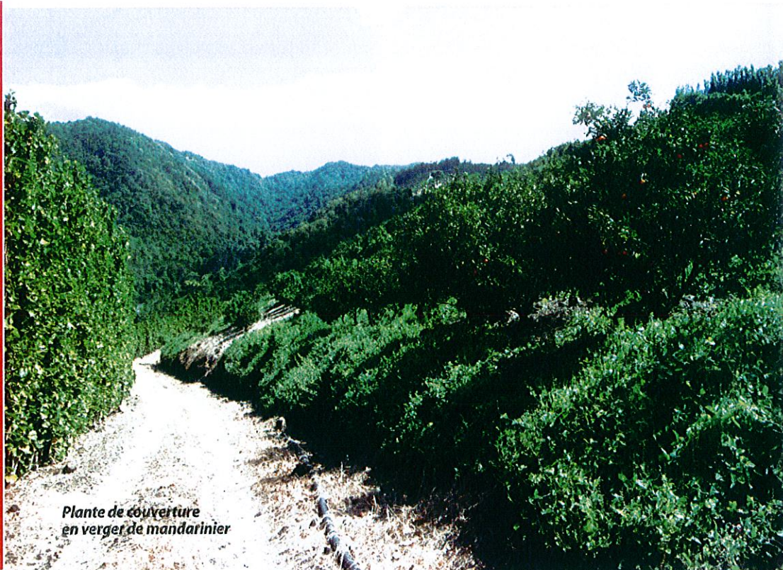
Plante de couverture en verger de mandarinier

Cette action est menée dans le cadre du projet DéPhi et a été cofinancée par l'Europe, l'ODEADOM et la Région Guadeloupe.