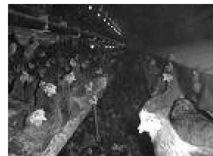
Figure 2. Volière.