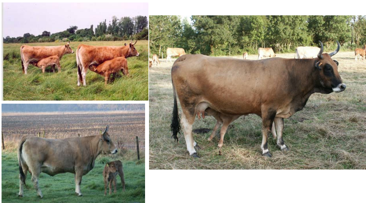
Animaux de race bovine maraîchine

Mots clés : suivi, gestion des races locales, vache maraîchine