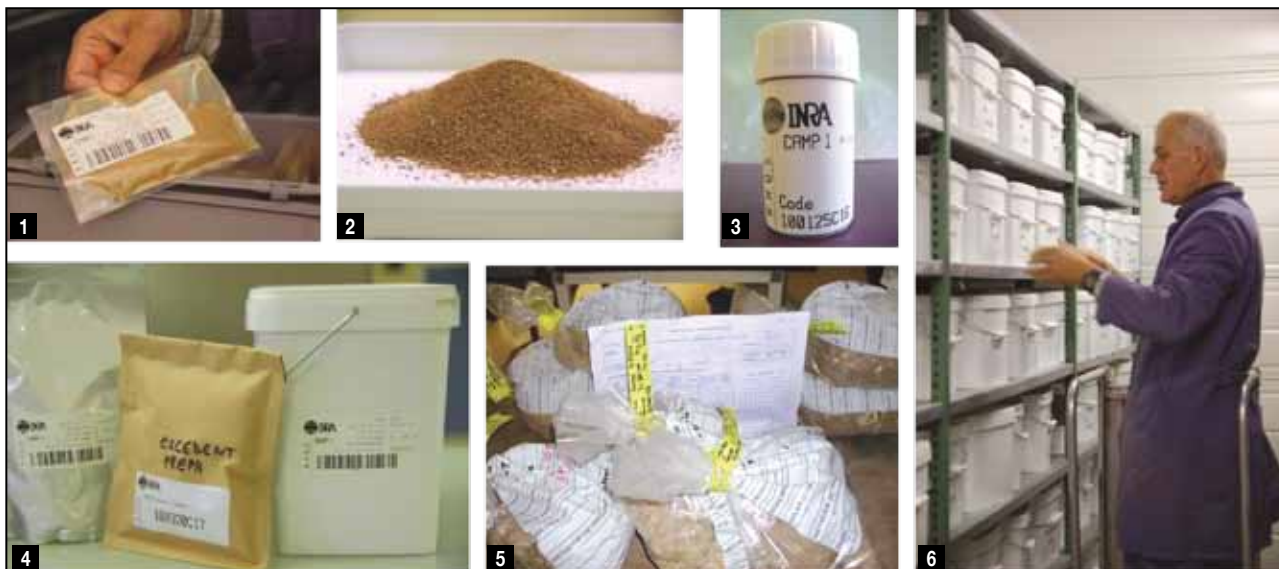
1 - échantillon issu de reliquat d'analyses, conditionné et étiqueté - 2 - sol tamisé à 2 mm - 3 - un flacon de sol conditionné pour analyse d'ADN microbien - 4 - différents contenants d'échantillons de sol utilisés au Conservatoire - 5 - échantillons issus de prélèvements de sol frais à la réception - 6 - la pédothèque

Pour l'identification, le suivi et la gestion des stocks d'échantillons, un système de codes-barres est utilisé qui permet de lier des échantillons à la base de données, d'actualiser leur appartenance à un nouveau programme, de suivre leur poids actuel et d'en gérer les stocks, et de connaître les analyses qu'ils ont subies ainsi que leur localisation dans la pédothèque.