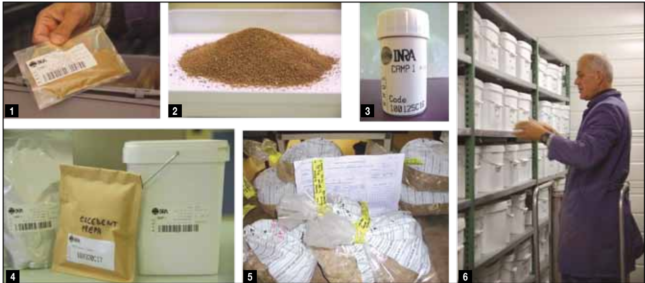
1 - échantillon issu de reliquat d'analyses, conditionné et étiqueté - 2 - sol tamisé à 2 mm - 3 - un flacon de sol conditionné pour analyse d'ADN microbien - 4 - différents contenants d'échantillons de sol utilisés au Conservatoire - 5 - échantillons issus de prélèvements de sol frais à la réception - 6 - la pédothèque

Pour l'identification, le suivi et la gestion des stocks d'échantillons, un système de codes-barres est utilisé qui permet de lier des échantillons à la base de données, d'actualiser leur appartenance à un nouveau programme, de suivre leur poids actuel et d'en gérer les stocks, et de connaître les analyses qu'ils ont subies ainsi que leur localisation dans la pédothèque.