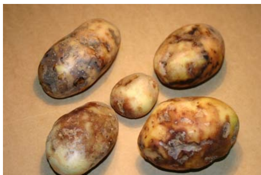
Photo 1 : Symptômes de mildiou sur des tubercules de pomme de terre

A chacune des deux récoltes, le nombre de tubercules contaminés est noté (observation visuelle). Les tubercules non contaminés ou apparemment non contaminés sont ensuite mis en incubation sous une bâche en jute dans un local à température ambiante pendant trois semaines, à la fin desquelles une nouvelle notation est réalisée. Le pourcentage total de contamination peut alors être calculé pour chaque parcelle et pour chaque géotype. Ces données une fois transformées [ transformation « Log (x+1) 】 peuvent être traitées en analyse statistique.