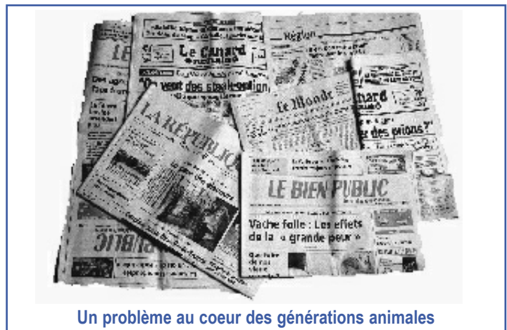
Un problème au coeur des générations animales

nous faut donc remonter le sens de l'histoire pour comprendre l'origine de ces derniers avatars de la connaissance et nous projeter dans l'avenir.