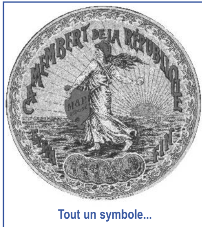
Tout un symbole...