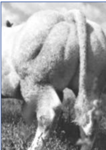
"Du beefsteak jusque dans les cornes" Charolais culard