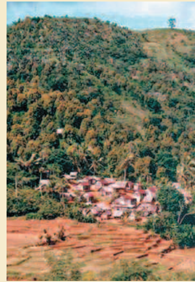
Paysage du nord-est de Madagascar, zone de présence de Prunus (riz, village, girofle, brûlis). Typical Prunus landscape in north-eastern Madagascar (rice fields, village, cloves, slash and burn).

filière, le coût des mesures à entreprendre sera exorbitant et complètement dissuasif. Il est alors probable que l'exploitation de cette ressource cesse à Madagascar.