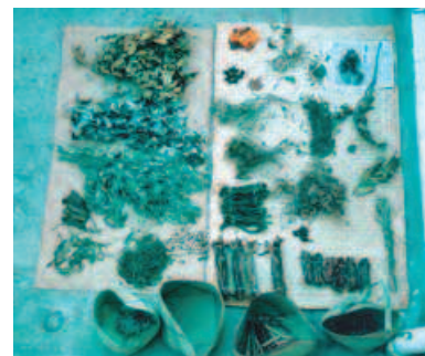
Plantes médicinales. Vente à Antananarivo, Madagascar. Medicinal plants on sale in Antananarivo.