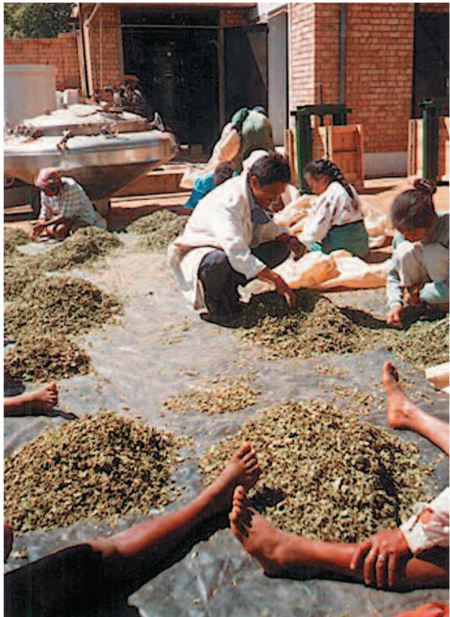
Tri manuel des feuilles de Centella à Madagascar. Manual sorting of Centella leaves in Madagascar.

Centella asiatica et Prunus africana sont les deux principales plantes médicinales exportées par Madagascar. Avec des caractéristiques très différentes en termes d'aires de répartition, de dynamique biologique et d'usages (tableau I),