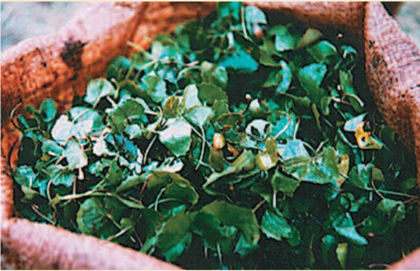
Centella fraîche. Fresh Centella.