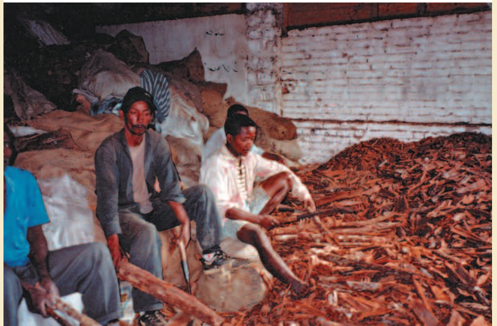
Unité de transformation du bois de Prunus . Processing Prunus wood.

À partir du cas des deux principales plantes médicinales exportées par Madagascar, Centella asiatica et Prunus africana , sont illustrées différentes modalités de partage juste et équitable, tel que préconisé par la Convention sur la diversité biologique, entre parties prenantes : laboratoire pharmaceutique étranger et entreprise malgache de bioprospection pour la première espèce, communauté locale et entreprise nationale exportatrice pour la seconde.