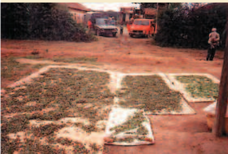
Centella séchée en entrepôts. Dried Centella in the Sotramex warehouse.