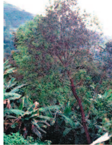
Prunus à Madagascar. Prunus in Madagascar .

une diversité de situations. Le fournisseur de ressources phylogénétiques est un acteur privé chargé de la collecte à l'échelle nationale (cas de Centella asiatica ) ou une collectivité locale (cas de Prunus africana ), en fonction des droits de propriété attribués sur la ressource. L'utilisateur est une firme internationale pharmaceutique ( Centella asiatica ) ou une firme nationale 2 . Dans le cas de Prunus africana , outre la question du partage des avantages qui est centrale dans notre analyse, se pose un problème de gestion durable de la ressource.