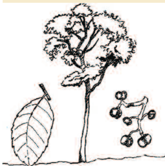
Planche botanique de Prunus . Site Fao, domaine public. Botanical plate of Prunus . FAO Site, no copyright.