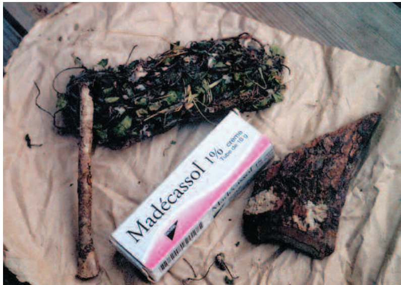
Les formes d'utilisation de Prunus et Centella : feuilles, écorces, spécialité pharmaceutique. Uses of Prunus and Centella : leaves, bark, pharmaceutical speciality.

cette convention a menacé d'en interdire toute exploitation commerciale. En réaction, le ministère des Eaux et Forêts a attribué à une société (la Sodip) le monopole légal d'exploitation de Prunus africana , au titre de mesure de protection de la ressource (BIODEV, 2000). En conséquence, cette entreprise apparaît comme l'exploitant principal de la ressource à Madagascar. Son usine transforme les écorces sèches de Prunus africana en extraits destinés à l'exportation pour le groupe pharmaceutique Inverni Della Beffa (Idb), qui les utilise dans la production d'un médicament traitant les troubles prostatiques.