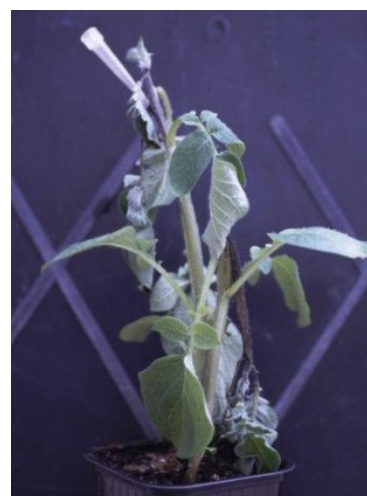
Inoculation sur Bintje avec la technique du cône