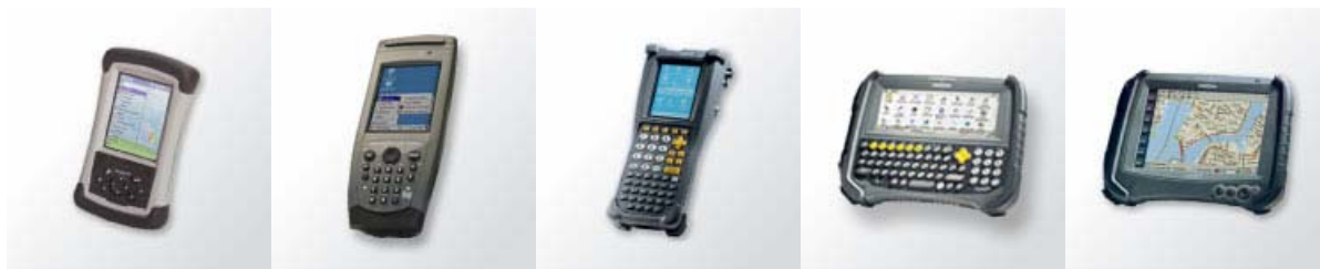
Figure 8 : Gamme DAP 15 technologies

La gamme de prix s'étend de 1300 €HT à 3500 €HT.