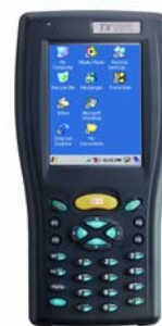
Figure 7 : TXCOM 14 Premium