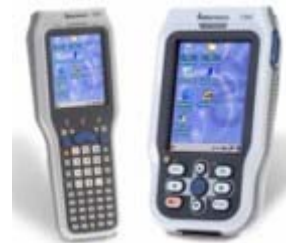
Figure 6 : Intermec 13