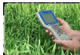
Figure 9 : JUNIPER 16 Allegro Cx

On minimise le risque de pertes de données.