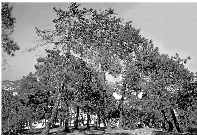
Photo 1 : Dépérissement d'un peuplement âgé de Pin maritime provoqué par Matsucoccus feytaudi Duc., en 1971, près de Cannes (06). Avant de mourir, les arbres présentent une abondante fructification.

Les "tables de survie" de l'insecte qui résultent de l'étude font effectivement ressortir ces différences, non seulement d'arbre à arbre (RIOM, 1979), mais aussi selon les régions (RIOM, 1980). Les facteurs qui les conditionnent sont de divers ordres et, très probablement, interagissent dans de nombreux cas.