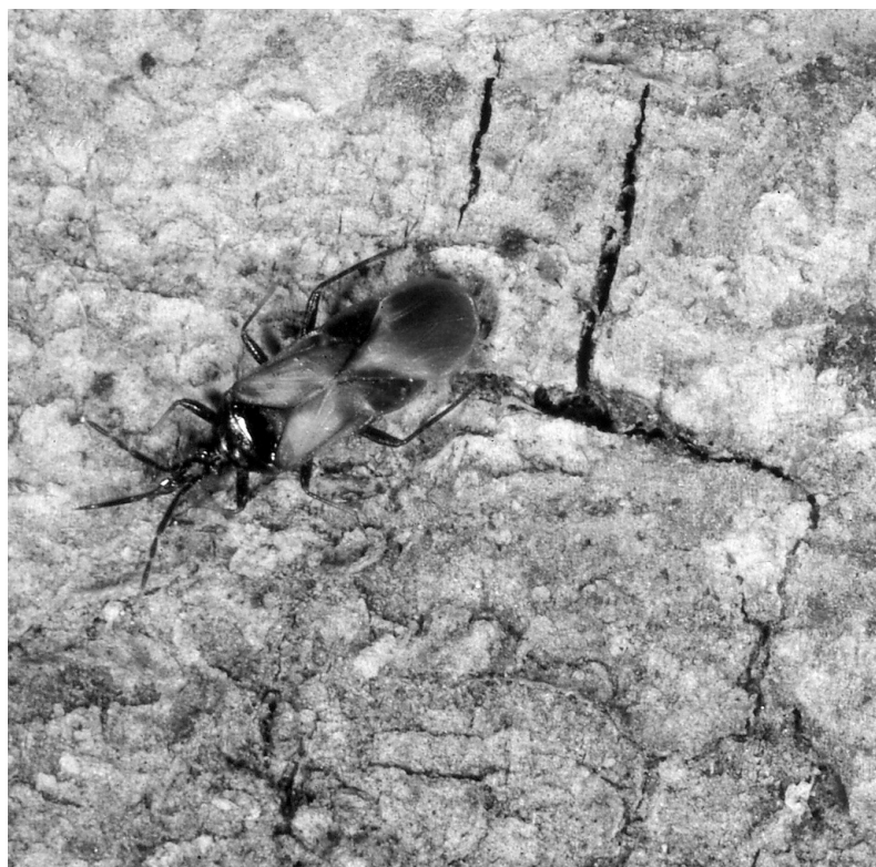
Photo 5 : Elatophilus nigricornis Zett. adulte, prédateur de Matsucoccus feytaudi Duc.

Dans les Maures et l'Estérel les peuplements de Pin maritime étaient sans doute aussi, comme on a pu le vérifier en Corse (Mission Fabre, juin 1976), tous totalement indemnes d' E. nigricornis avant l'introduction de M. feytaudi . Dès son introduction, les populations de Cochenille se sont développées et les mortalités des pins sont apparues à partir de 1957. Cependant, entre 1964 et 1967, les observations conduites sur les peuplements déperissants montraient qu'ils étaient apparemment encore indemnes d' E. nigricornis et l'on pensait à cette époque qu'il fallait l'introduire à partir du massif landais (RIOM & GERBINOT, communication personnelle). On suppose que l'arrivée d' E. nigricornis dans les peuplements de Pin maritime déperissants a pu se faire à partir des populations naturelles de punaises associées à M. pini dans les peuplements de Pin sylvestre situés assez loin dans l'arrière-pays. Quelques années ont donc été nécessaires avant de constater la présence d' E. nigricornis dans les peuplements de Pin maritime. Il y fut observé pour la première fois à Notre-Dame-des-Anges, dans les Maures en 1967.