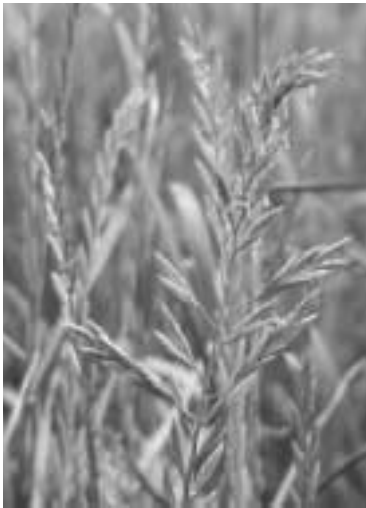
FIGURE 2 : A branched spike-like inflorescence characteristic of Festulolium.