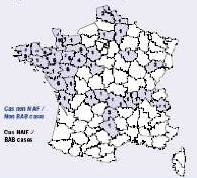
Figure 1 Répartition géographique des cas d'ESB en France (au 1 er juillet 2000) / Geographical distribution of cases (1 July 2000)

Since 1996, the National Brigade for Veterinary and Health Inquiries (Brigade Nationale d'Enquêtes Vétérinaires et Sanitaires, BNEVS) has conducted an in-depth epidemiological investigation in each farm affected by BSE (4). The investigation is based on an interview with the farmer and an analysis of the farm's registers and accounts, and addresses the status of the infected animal's mother, its diet since birth, the suppliers of the commercially available feeds distributed, the presence of other animal husbandry units on the farm, the use of organic fertilizers from outside the farm, and medications used. Further investigations are carried out on the premises of the cattle feed manufacturers supplying the farm, to evaluate the potential contamination of the feeds by products of rendering plants.