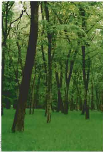
Peuplement typique de la Forêt domaniale de la Harth (chênes sessile, pédonculé, pubescent, charme, ...)

Les chênes de la forêt domaniale de la Harth ont été particulièrement affectés à partir de 1992 par un dépérissement aigu se traduisant par des mortalités massives d'arbres. Plus de 35 000 m 3 de bois sec ou dépérissant d'essences feuillues, dont 95 % de chênes, ont été récoltés entre 1992 et 1996,