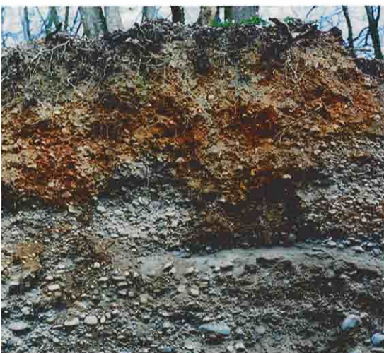
Dans ces sols alluviaux, l'enracinement est fortement influencé par les couches d'éléments de granulométrie différentes

diennes pour les stations météorologiques les plus proches (Bâle et Colmar, source Météo-France). Le déficit hydrique a été calculé pour chaque année et chaque placette.