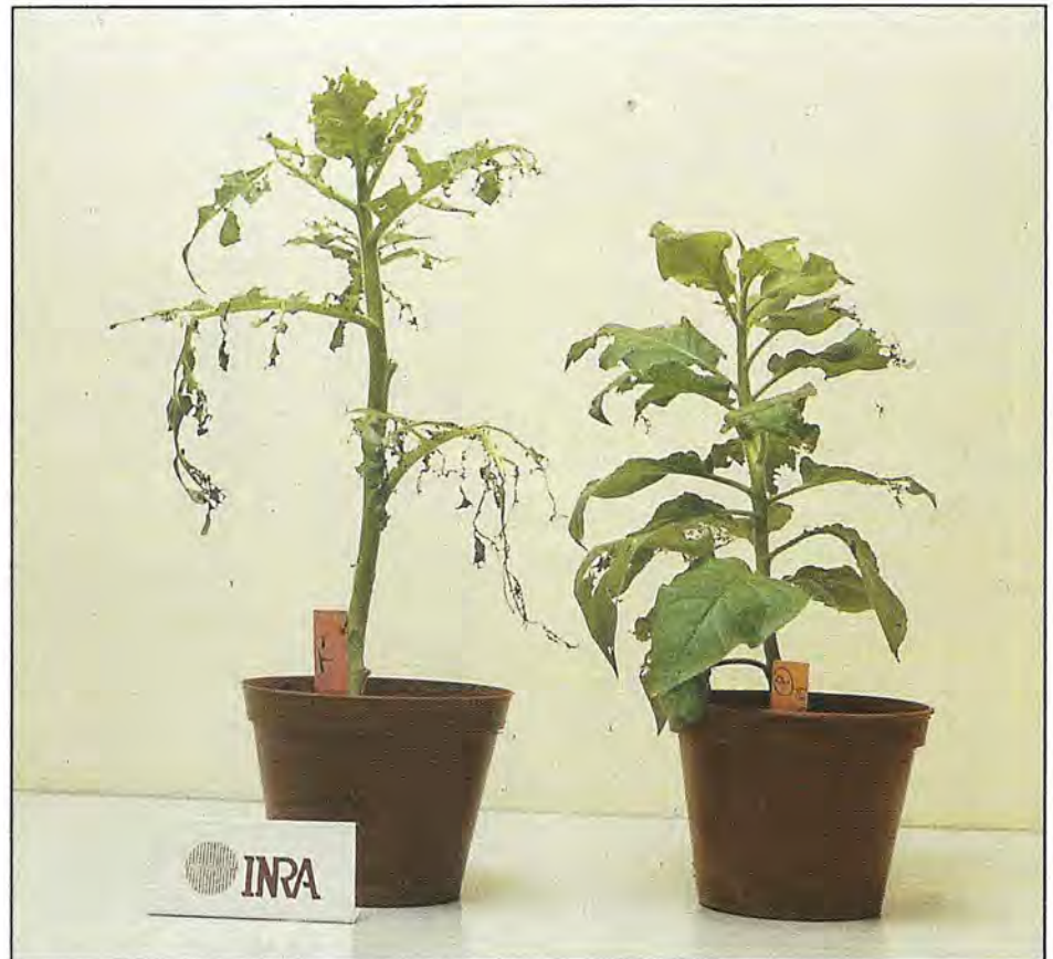
2 plants de tabac : à gauche - Plante témoins, à droite - Plante génétiquement transformée.

culier, de contrôler les conséquences de l'application de cette nouvelle technique de lutte sur l'équilibre des biocénoses et de mesurer les risques de contournement de cette résistance... compte tenu de la remarquable capacité d'adaptation dont font preuve les insectes.