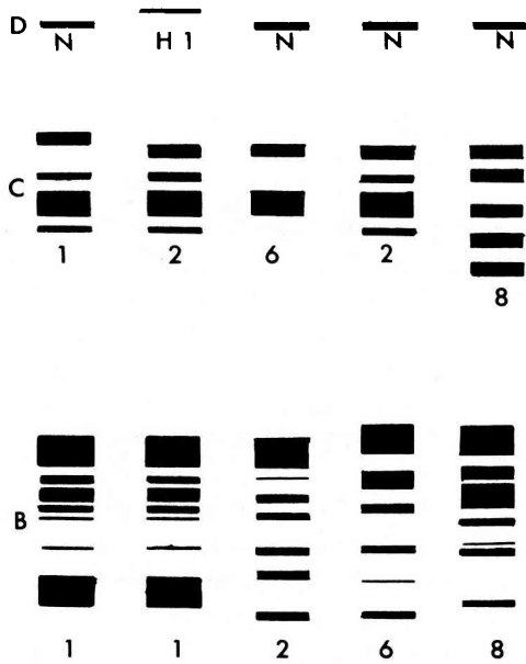
Fig 2. Représentation schématique des électrophorogrammes observés le plus fréquemment dans la collection d'orges étudiée.

la figure 1 sera notée : B8C8N. Nous avons gardé la numérotation de Montembault (1982) pour tous les types qu'il a déjà décrits.