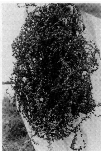
Fig. 2a. Pseudocompatibilité élevée ( I_1 1988).

Le pourcentage de glomérules viables, (% gv) c'est-à-dire de cymes* ayant au moins une graine fertile, est déterminé par le test dit du marteau. Pour cela, une vingtaine de glomérules de chaque lot sont écri-