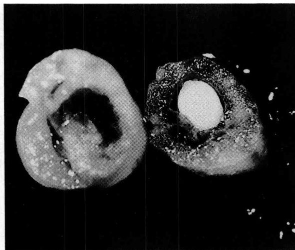
Fig. 2 Embryon globulaire dans une ébauche de pépin de la variété Sultana moscata cultivée in vitro (grossissement : x 20).