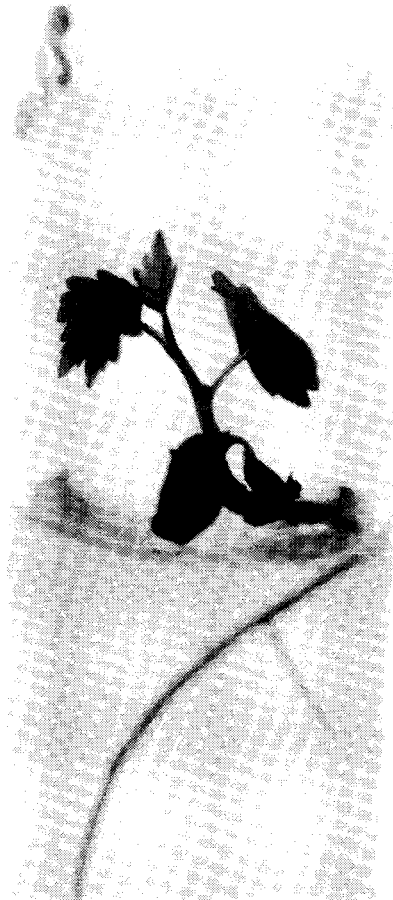
Fig. 4. Embryon de la variété Sultanine blanche se développant en plantule.

Les travaux de culture d'ovules et d'embryons in vitro , menés en 1987-1988 à la station de recherches viticoles de Montpellier, ont porté sur un nombre important d'ovules et de variétés. Ils