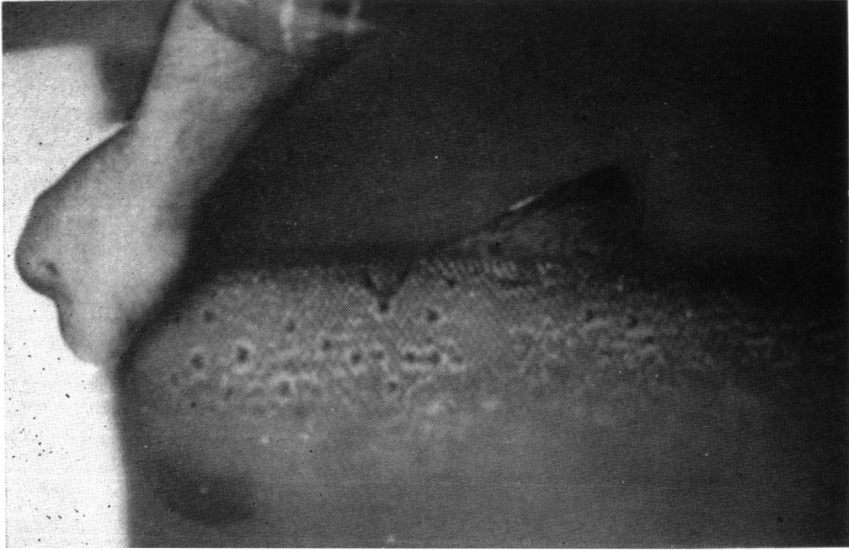
Fig. 1 : Tatouage (V) sur le flanc d'un saumon atlantique adulte revenu dans la Nivelle 20 mois après son cryomarquage comme smolt de deux ans. La lecture est effectuée sous l'eau du bain anesthésiant.