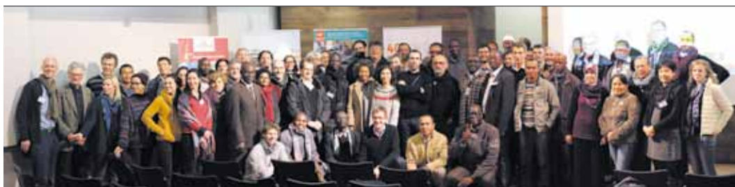
Une partie des 105 participants présents lors de l'atelier à Nogent-sur-Marne, sur le campus du Jardin d'Agronomie Tropicale de Paris, les 14 et 15 décembre 2017.

GTAE, 2018. Agroécologie : méthodes pour évaluer ses conditions de développement et ses effets. Actes de l'atelier d'échanges et construction méthodologique. 14-15 décembre 2017. AFD/FFEM, 52p.