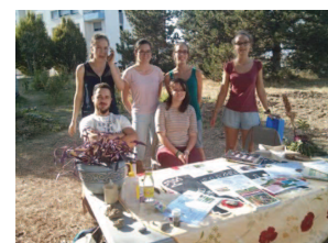
Figure 3: L'équipe «Urba Green», au cours d'une soirée d'animation, au jardin du Mini M.

• « Urba Green » a développé une animation autour d'une meilleure connaissance de l'écosystème sol, d'un projet d'aménagement de la partie collective du jardin et d'une pédagogie des pratiques agroécologiques (Figure 4).