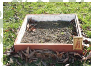
Figure 4 : Les axes de travail du projet tutoré « Urba Green » : 1- Documenter les caractéristiques du sol, avec des méthodes simples et peu coûteuses. 2- Créer des supports pédagogiques et partager des savoirs agronomiques. 3- Aménager la partie collective du jardin du Mini M. 4- Créer des parcelles expérimentales pédagogiques.