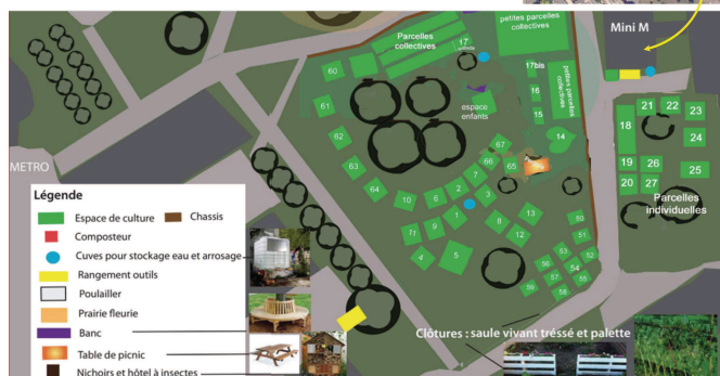
Figure 1: Environnement (Géoportail, 2015) et plan du jardin du Mini M en 2017.