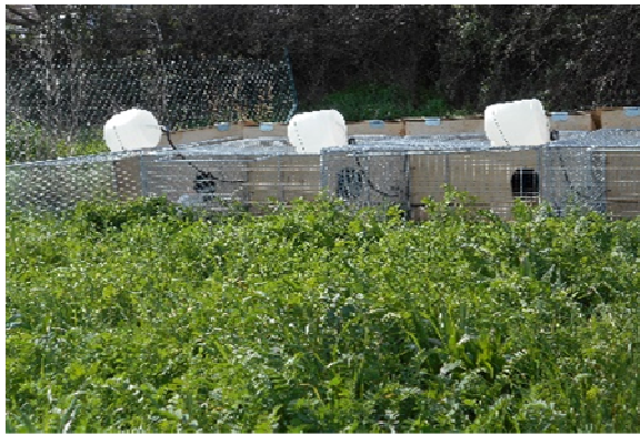
Figure 1 : Cages mobiles sur pâture de sainfoin (printemps 2016)

Les lapins sevrés ont été logés en cage-mobile de petite taille accueillant 3 lapins par cage à partir du sevrage et pendant 9 semaines. Les cages-mobiles sont constituées d'un abri en bois, ainsi que d'une aire d'accès au pâturage de 1,2 m 2 (soit 0,4 m 2 /lapin) pour respecter la norme de surface pâturable en cuniculture AB; et elles ont été déplacées quotidiennement. Au sein de chaque cage-mobile durant la période d'essai en été 2015 et au printemps 2016, un lapin avait été élevé jusqu'au sevrage en cage-mobile, et les autres élevés dans le tunnel semi-ouvert. Alors que durant l'hiver 2014/2015, l'ensemble des lapins avaient été élevés jusqu'au sevrage dans le bâtiment semi-ouvert.