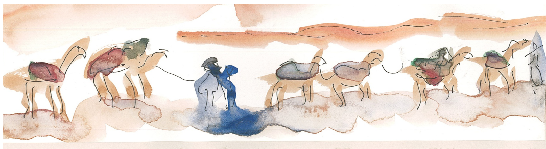
Figure 3. Aquarelles lors du voyage en Mauritanie, carnet de voyage 2006

Une semaine dans le désert près d'Atar, avec un guide pour trouver notre chemin sur le sable et une cuisinière pour nous restaurer et nous reposer. Le reste du temps est lumière, soleil, ombre, chaleur et couleur.