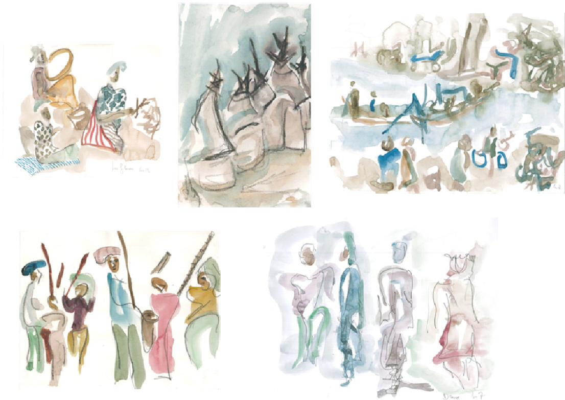
Figure 4. Aquarelles lors du voyage au Mali, carnet de voyage 2009

Une semaine en pays Dogon, avec Allaye et Bafou comme guides pour le chemin et la culture dogon, que l'on ne peut pas dissocier tant l'histoire est inscrite dans le paysage, le présent dans les traits des visages, l'avenir dans les rides du temps. Fileuses de laine ou pileuses de mil, les femmes sont de toutes les activités, avec leurs visages impassibles et leurs gestes en rondeur, tout comme les buttes du village. Que ce soit le passage du fleuve pour rejoindre Djenné ou la danse des musiciens le soir à la veillée, le mouvement en douceur des pagaies sur l'eau ou la frénésie des battements de jembé nous fait vibrer.