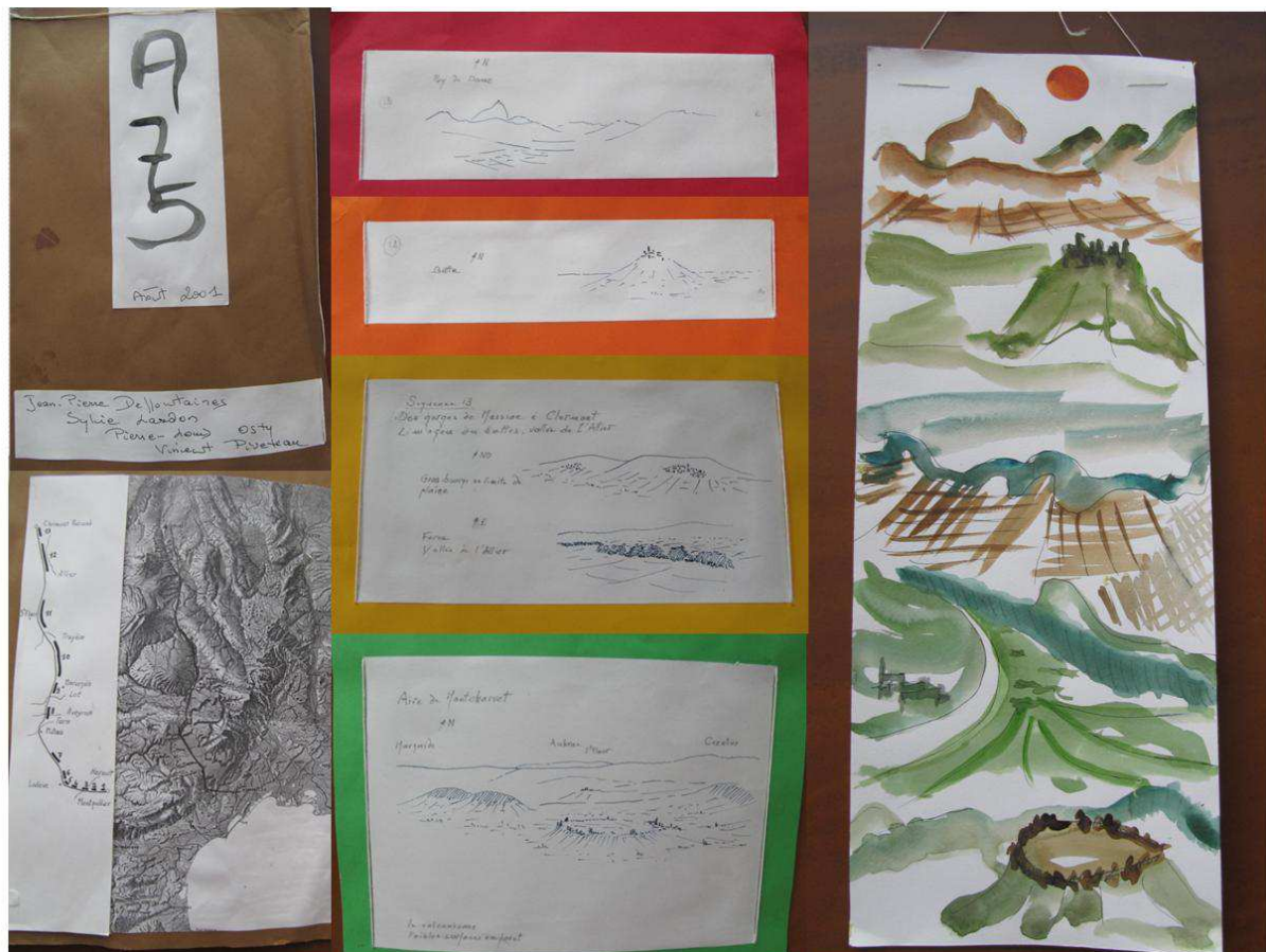
Figure 2. Chorèmes et paysage de l'A75 (d'après Lardon, 2012).

L'A75 se parcourt en quatre étapes et treize unités paysagères de Montpellier à Clermont-Ferrand. Au regard des unités paysagères dessinées par Jean-Pierre Deffontaines, j'ai dessiné les configurations spatiales représentatives de l'étape. Ici, les formes du volcanisme de l'Aubrac à la Chaîne des Puys, en passant par les gorges de l'Allier et les buttes de Limagne.