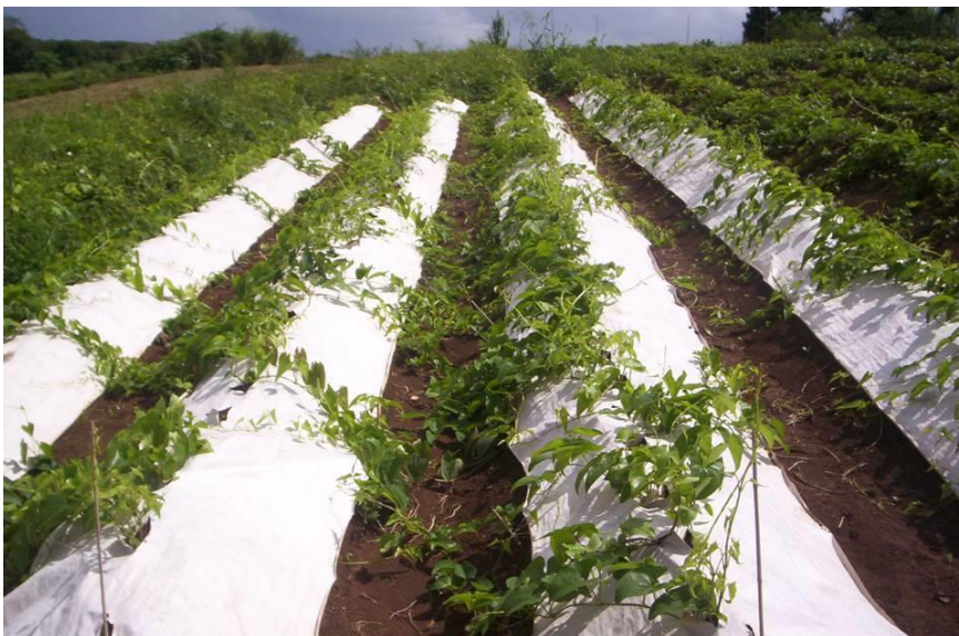
Photographie 3 : Développement de la culture d'igname 3 mois après la plantation (Yam development 3 months after planting)

Le développement de la culture a été suivi ainsi que l'état sanitaire.