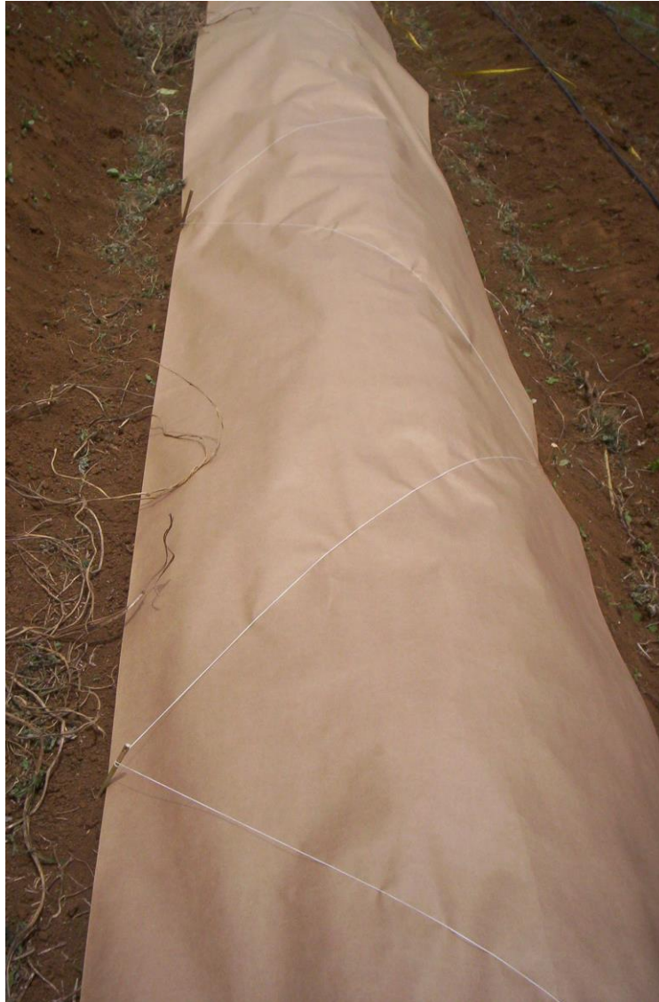
Photo 1 : Système de fixation du paillage papier (Fixation system of paper mulch)

L'utilisation d'agrafes métalliques comme pour les toiles n'a pas été développée. Les agriculteurs chez qui les tests ont été menés, par peur d'endommager les pneumatiques des engins, refusent l'emploi de ce type de matériel .