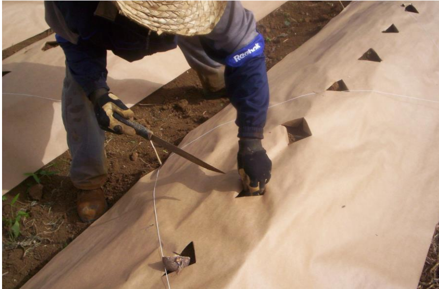
Photographie 2 : Percage du paillage et mise en place des semenceaux (Drilling of mulch and establishment of seeding)

La plantation est faite manuellement tous les 30 cm sur le billon et les billons sont espacés d'un mètre cinquante (cf photographie N°2) (20 000 plans.ha -1 )